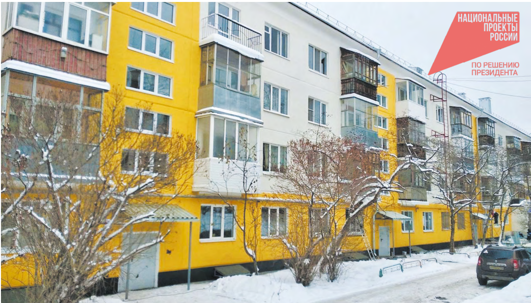
Во время капитального ремонта преобразается не только фасад дома, но и внутренние коммуникации, кровля, а часто и внешний вид подъездов

— В 2026 году обновим почти 900 многоквартирных домов в Свердловской области – это значительно больше, чем в прошлом году, — написал глава региона в своих социальных сетях. — В домах будут проведены ремонтные работы, которые запланированы в региональной программе капремонта. По словам директора областного фонда капитального ремонта Станислав Суханов, на данный момент строительно-монтажные работы в рамках региональной программы завершены во всех 722 объектах жилфонда, стоящих в плане на 2025 год. — Стоимость выполненных работ составила порядка 6,9 миллиарда рублей, — уточнил он. Наибольший объем работ в 2025 году пришелся на ремонт крыш — обновлено 494 кровли, в том числе в 17 домах выполнено усиление межэтажных перекрытий. Также в 179 многоквартирных домах заменены системы водоотведения, в 163 – системы электроснабжения, в 161 доме проведен ремонт внутридомовых систем теплоснабже-