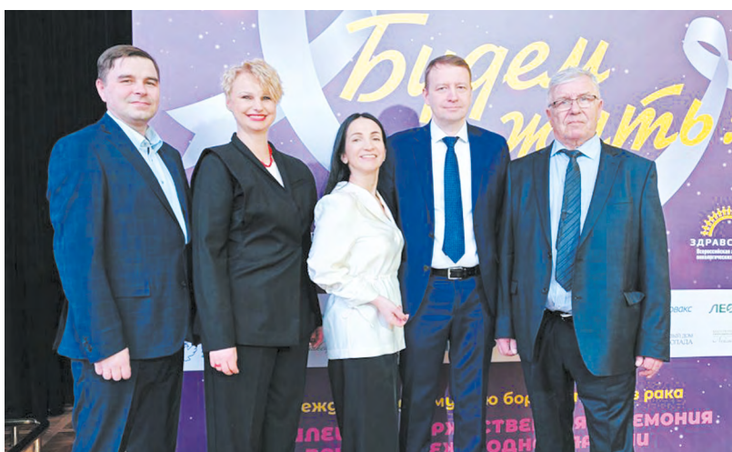
▲ Свердловский областной онкодиспансер признан одним из лучших профильных учреждений в стране