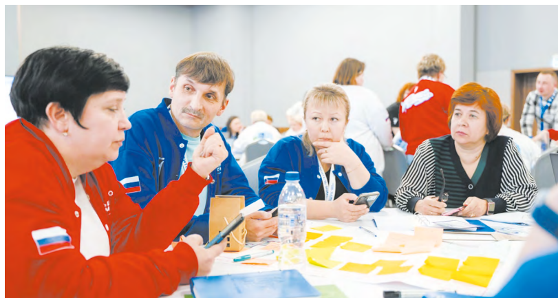
▲ Свердловские педагоги-наставники представили регион на программе конкурса «Большая перемена»