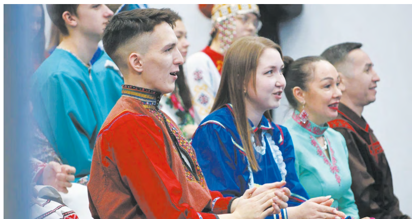
▲ Год единства народов России официально стартовал. В честь этого события состоялась торжественная церемония. Она прошла на площадке студии Российского общества «Знание»