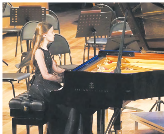
▲ Исполнительница из Екатеринбурга завоевала Гран-при II Конкурса пианистов имени Гнесиных