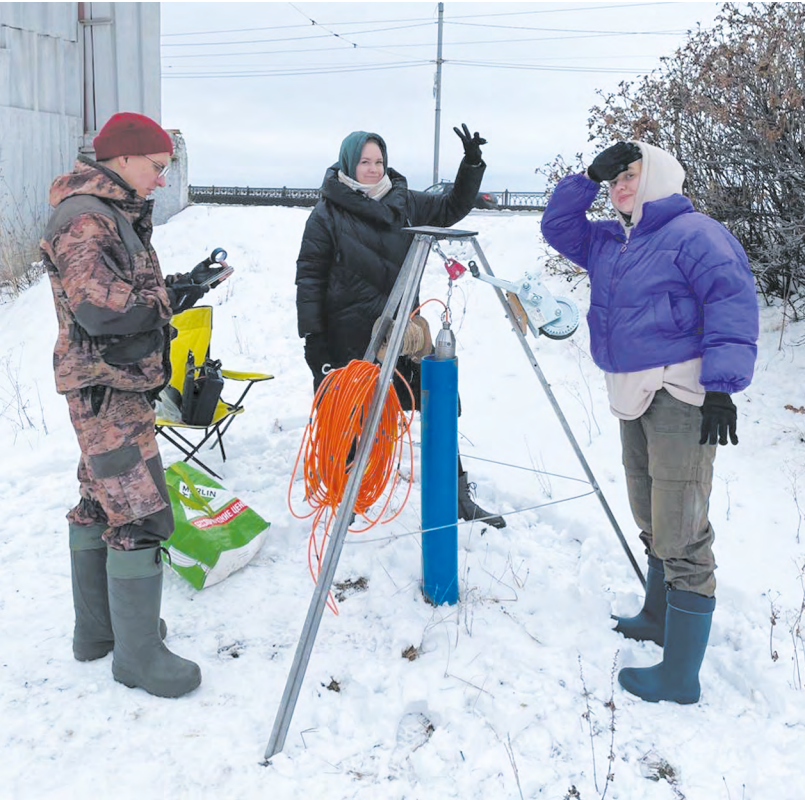
Зимние полевые работы геофизиков