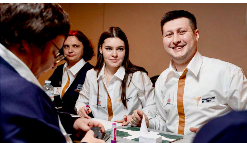
▲ Свердловские специалисты представили регион на Международном форуме «Новая философия воспитания»