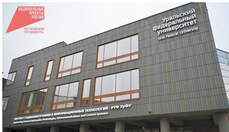
Кампус УрФУ — это супер-современная территория для студентов, их учебы, досуга, спорта и саморазвития!

Свердловский департамент информполитики напоминает, что кампус начал свою работу два года назад с введением первой очереди. На территории есть собственный медицинский центр с пропускной способностью 400 человек в смену, тренировочное поле с легкоатлетическими дорожками. Все занятия проходят в самом современном учебном корпусе.