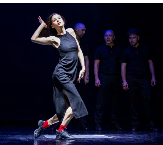
▲ Один из старейших уральских фестивалей «На грани» в этом году проходит в 12-й раз