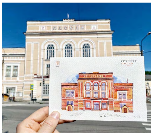
Настоящим архитектурным музеем под открытым небом имеет все шансы стать и Ирбит!