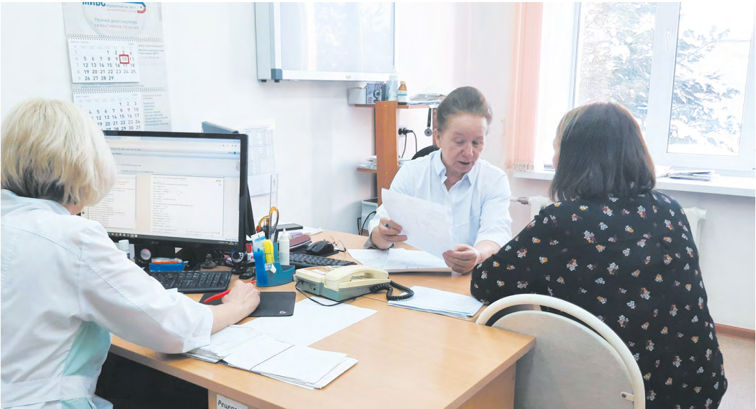
390 тысяч уральцев получили льготные рецепты с начала текущего года на общую сумму 21,5 миллиарда рублей. Среди них — 23 тысячи детей!

По словам губернатора, Свердловская область входит в число лидеров по объему средств бюджета, направленных на лекарственное обеспечение.