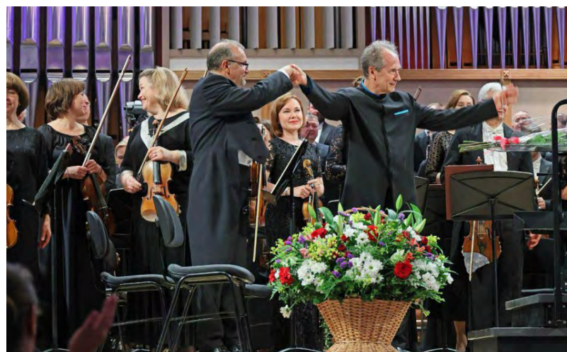
▲ Уральский филармонический оркестр в четвертый раз стал лауреатом Большой оркестровой премии «440 герц»