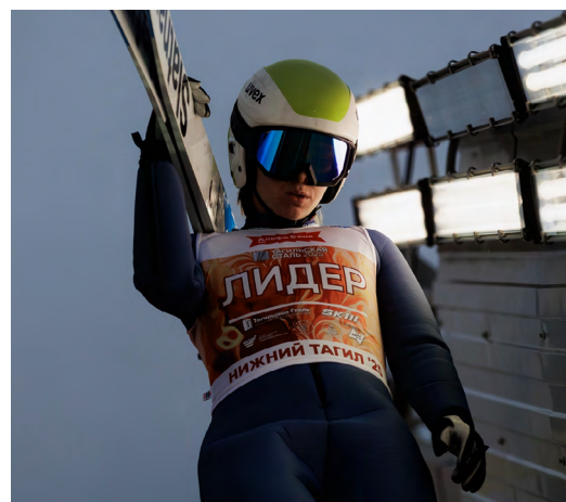
▲ Свердловские спортсмены завоевали пять медалей на зимнем этапе Кубка «Тагильская сталь»