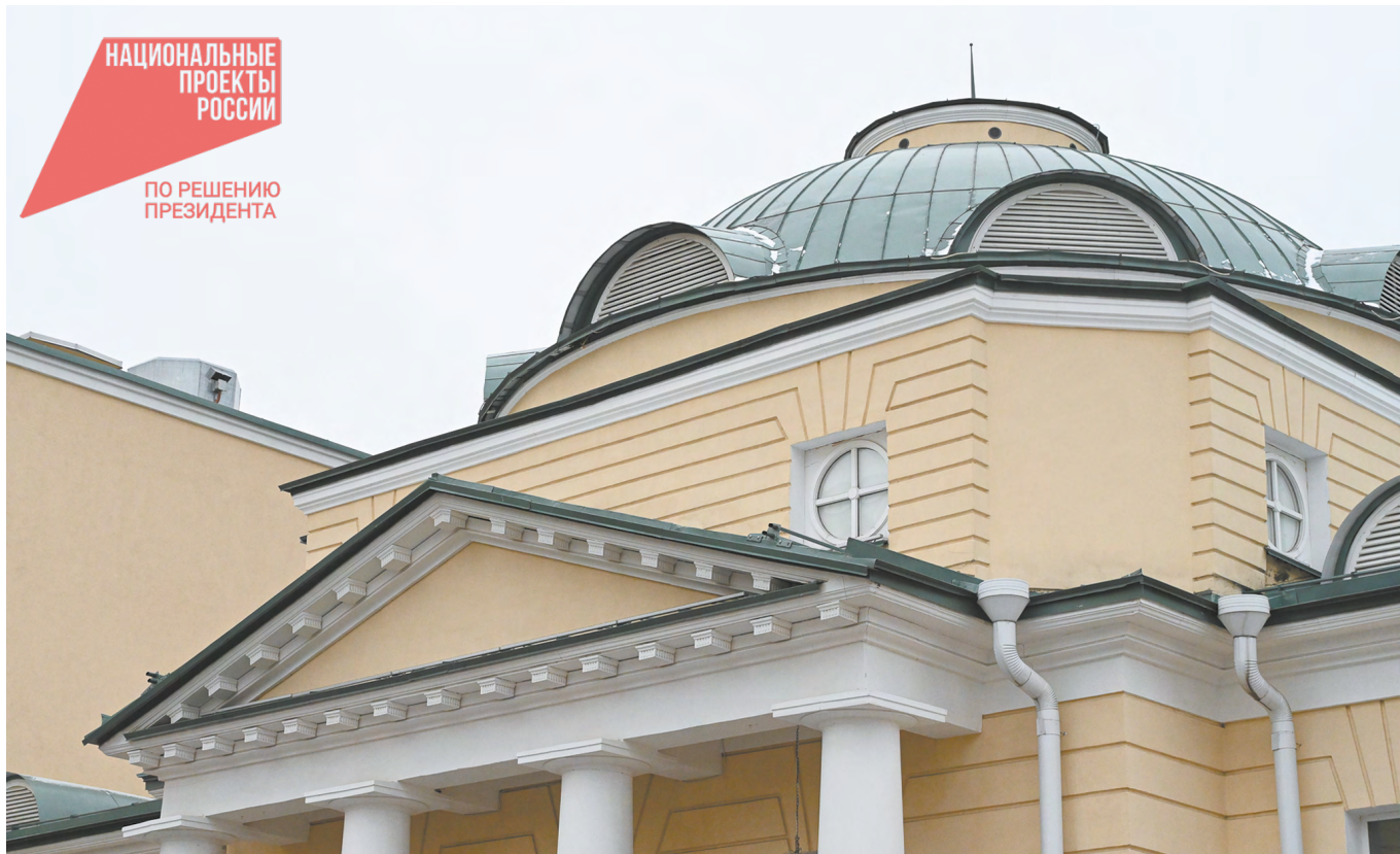
Этому зданию в центре уральской столицы повезло: «Синара Центр» – это современный культурно-выставочный комплекс, который разместился в стенах бывшего госпиталя Верх-Исетского завода