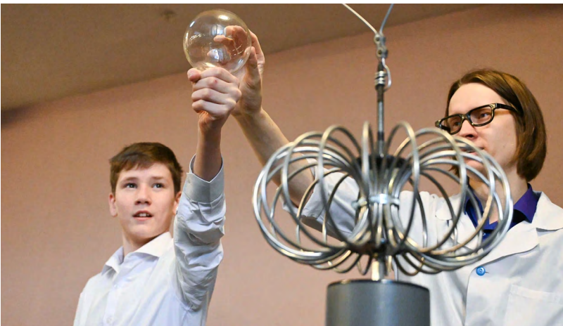
▲ Театр, лазеры и инклюзия: как прошел праздник к Международному дню инвалидов