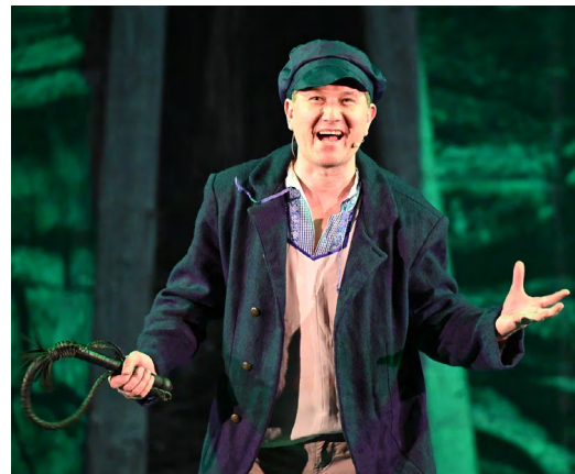
▲ Екатеринбургцы познакомились с новогодними традициями финно-угорских народов