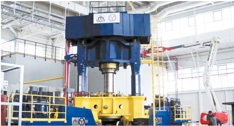
В цехе по выплавке титановых слитков уже работают 36 специалистов. В начале 2026 года производство выйдет на полную мощность, и количество рабочих мест увеличится до 115

Губернатор Денис Паслер уточняет: в особой экономической зоне зарегистрировано сегодня 25 компаний-резидентов. В создание производственных площадок они уже вложили более 50 млрд рублей, создали более 5,7 тысячи рабочих мест. В бюджеты всех уровней в виде налогов, страховых взносов и таможенных пошлин от производственной деятельности резидентов поступило 24,8 млрд рублей.