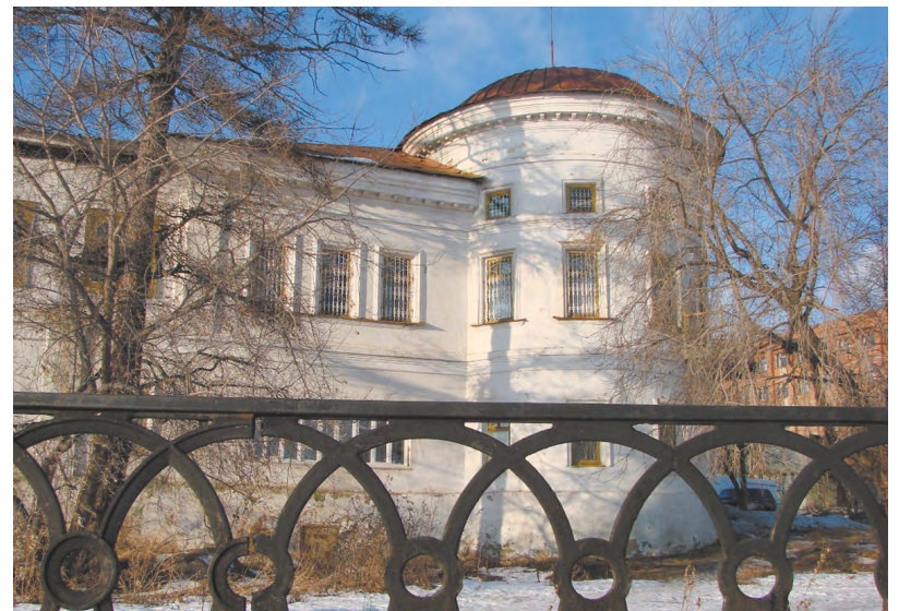
В Реже тоже немало исторических зданий, и общественники надеются на здравомыслие городских властей в деле их сохранения, а возможно, и реставрации!

Исторический центр Режа хранит уникальные памятники. Нагорный храм, единственная уцелевшая с дореволюционных времен церковь, представляет собой редкий пример русско-византийского стиля. С Господским домом, самым старым зданием