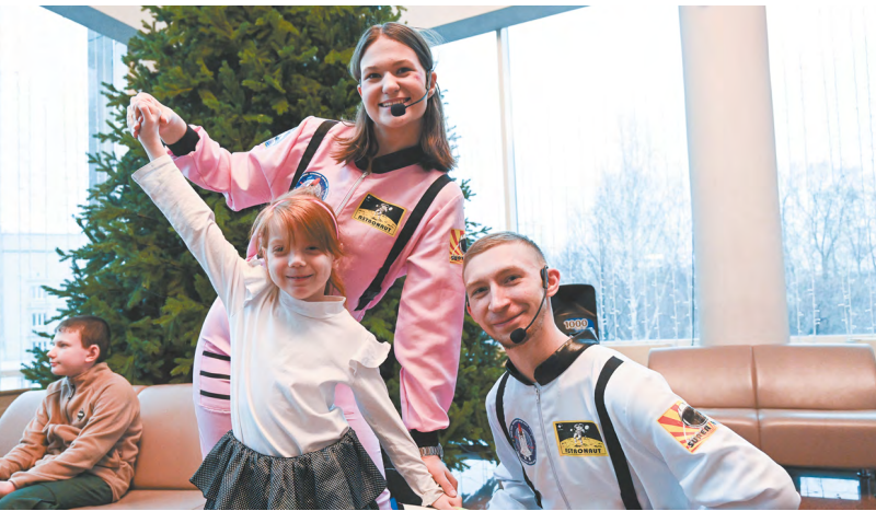
В программе: лазер-шоу, иллюзионисты с фокусами и птицами, шоу-барабанщиков, рисование картин красками на воде и многое другое