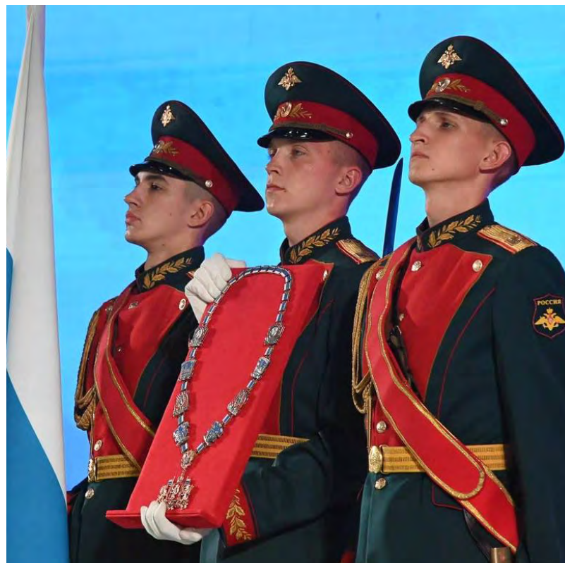
▲ Почетный караул вынес на сцену государственный флаг РФ, флаг Свердловской области и должностной знак главы региона