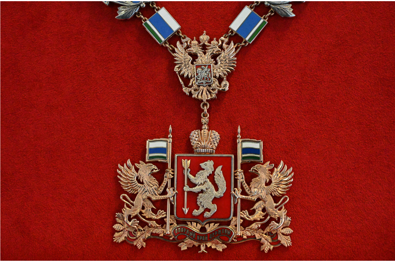
▲ Должностной знак главы Свердловской области состоит из 33 звеньев. На них – Данила-мастер с дружкой горного хрусталя в руках, танк Т-34, а также символика атомной науки и архитектурные доминанты областной столицы