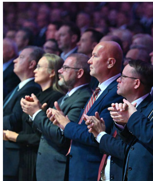
▲ Гости, разместившиеся в киноконцертном зале «Космоса», аплодировали избранному главе региона Фото Елены Ельцовой

▼ Во время церемонии инаугурации прозвучали патриотические песни в исполнении уральских коллективов Фото Елены Ельцовой