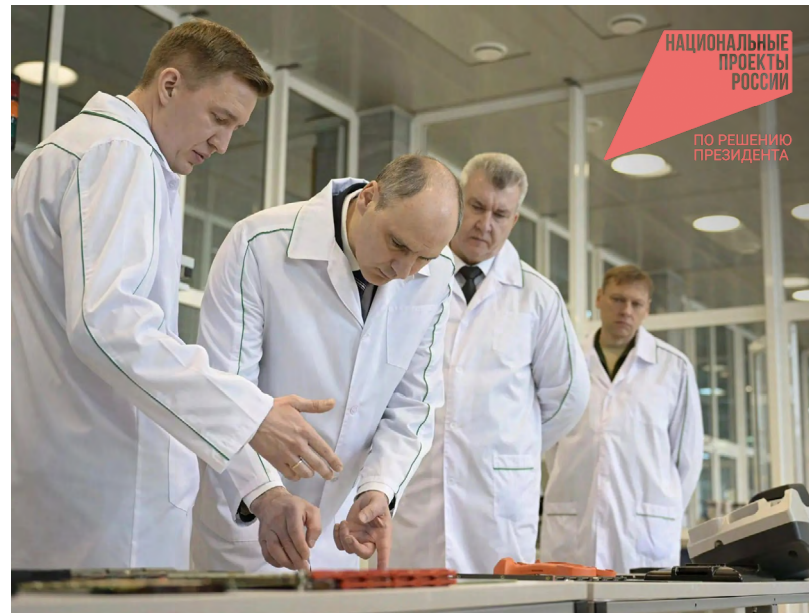
Активное развитие промышленных предприятий соответствует задачам нацпроекта «Средства производства и автоматизации»

Пуск новой российской ракеты-носителя среднего класса «Союз-5» с 45-й площадки космодрома Байконур состоялся 30 апреля. Это первый старт ракеты нового поколения в рамках летно-конструкторских испытаний.