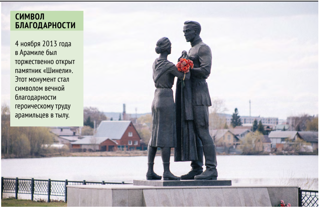
Здесь, у арамилского памятника, прошлое говорит с настоящим — о войне, труде и цене Победы

4 ноября 2013 года в Арамиле был торжественно открыт памятник «Шинели». Этот монумент стал символом вечной благодарности героическому труду арамилцев в тылу.