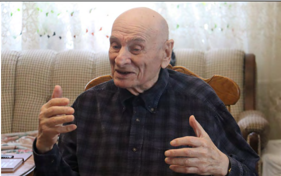
Ему есть о чем вспомнить, о чем рассказать, чем поделиться. И сегодня его не покинуло здоровое чувство юмора, хотя значительная часть его жизни была совсем не смешной...

— Это благословенное место, — уверяет он и объясняет, что именно здесь сумел стать востребованным человеком — приобрел бесценный опыт и профессионализм, начал помогать людям и как медик, и как авторитетный политик. — Шли годы, а я ничего обидного про себя не слышал.