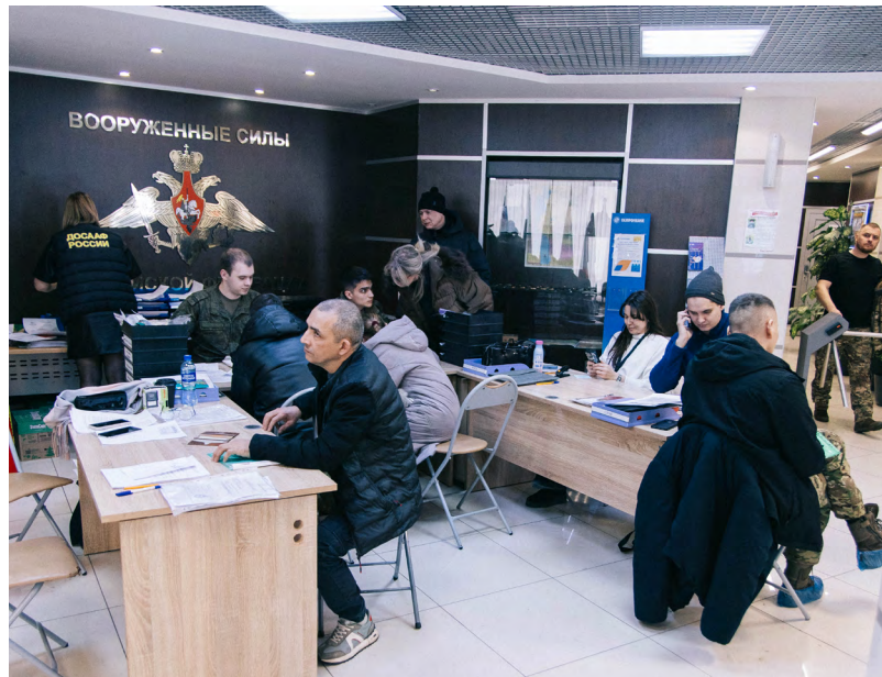
В пункте отбора на военную службу по контракту – очереди из желающих послужить Родине. Популярностью у молодежи пользуются новые войска беспилотных систем, свои предпочтения у кандидатов других возрастов