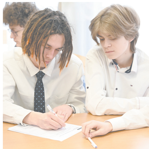
▲ Включили информационную защиту: в школе № 143 Екатеринбурга прошел открытый урок по борьбе с киберпреступностью в социальных сетях. Фото: Елена Ельцова

▼ В природном парке «Бажовские места» начата раскладка вакцины от бешенства животных, по области их разложат 450 тысяч доз. Фото: Елена Ельцова