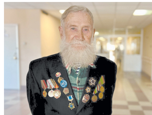
Фото: госпиталь ветеранов войн

Комплексный осмотр показал, что большинство ветеранов обладают удивительным запасом сил и энергии. Почти все были допущены к участию в праздничном мероприятии.