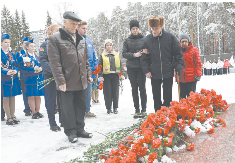
▲ Уралцы почтили память узников фашистских концлагерей на Широкореченском мемориале.