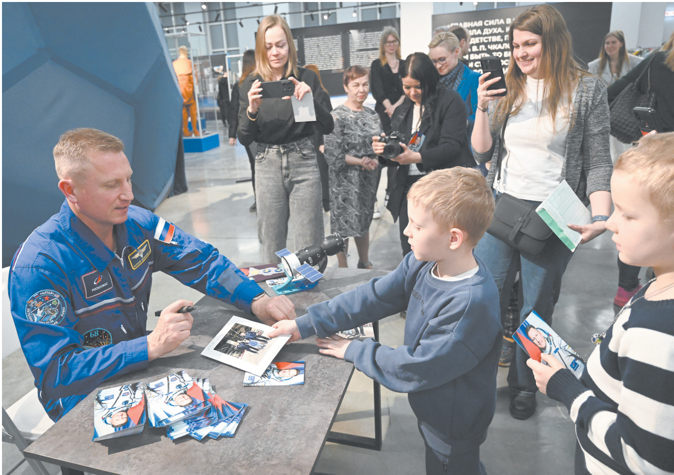
▲ «В 43 года моя мечта сбылась – я полетел в космос». Уральский космонавт Герой России Сергей Прокопьев в планетарии Верхней Пышмы рассказал о жизни на орбите, лунной гонке и как стать частью команды Роскосмоса.